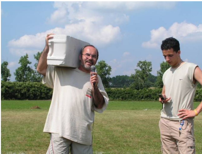
A Községi Ház alapkő letétele sajnós, – az építési engedély hiánya miatt – halasztásra került.