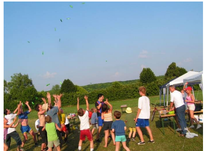
A „csoki eső” hullásának változatlanul nagy a sikere.