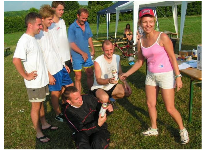
A foci nyertesei először nem akartak hinni a szemüknek, a kapott díj láttán.