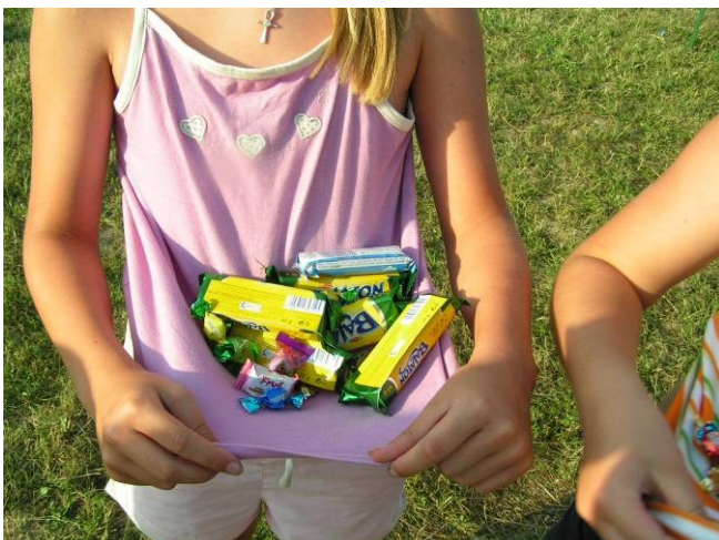
Az ügyesebbek komoly mennyiségű zsákmányra tettek szert.