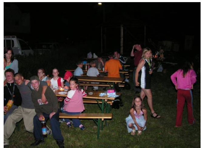
Az esti-éjszakai „játszótér-partin” gyermek és felnőtt egyaránt jól érezte magát.