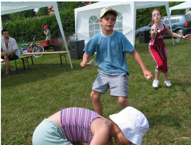
A gyerekek különböző versenyszámokban ügyeskedhettek.